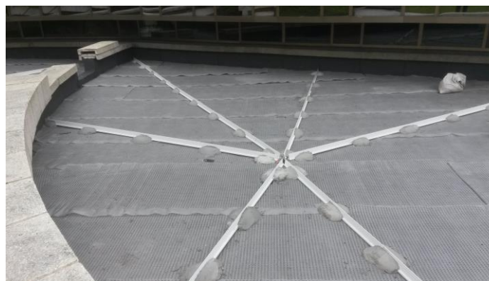
Pose ALVEODRAIN F et joints radiaux